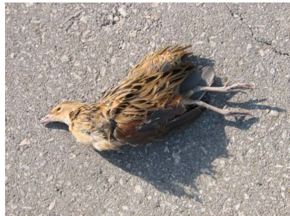
Фиг. 95 Убит ливаден дърдавец на пътя