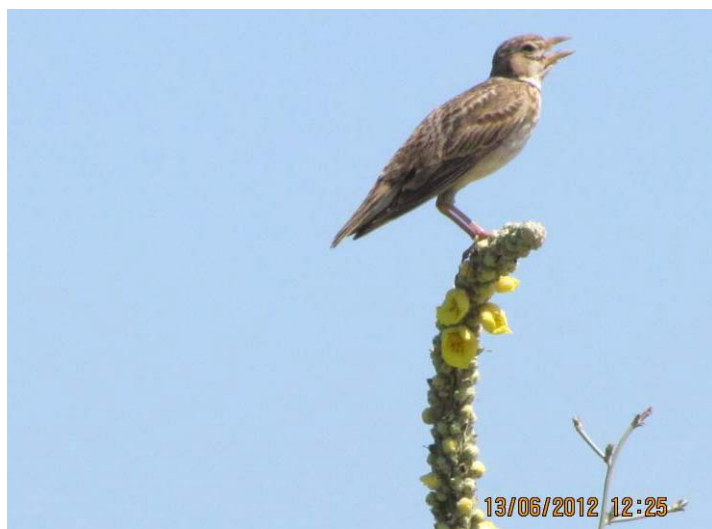
Снимка 47 Дебелоклюна чучулига в 33 „Рупите”