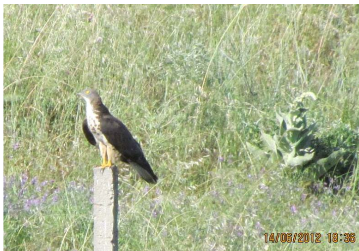
Снимка 46 Осояд в 33 „Рупите”