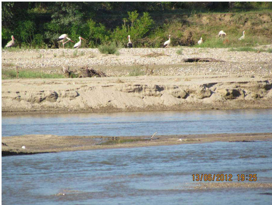
Снимка 49 Летуващи бели щъркели по поречието на река Струма в ЗЗ „Рупите“