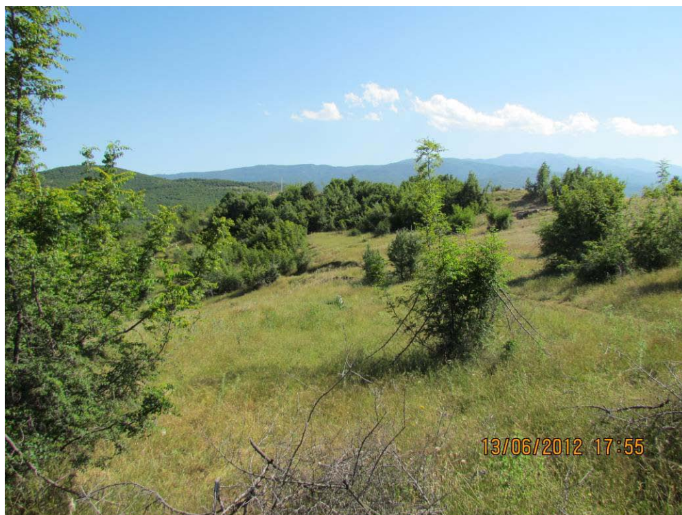
Снимка 50 Местообитания, обект на проучване в ЗЗ „Рупите“