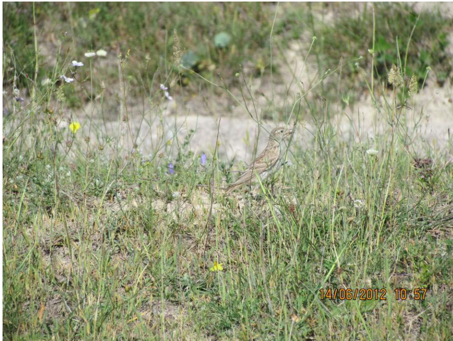
Снимка 48 Късопръста чучулига в ЗЗ „Рупите“